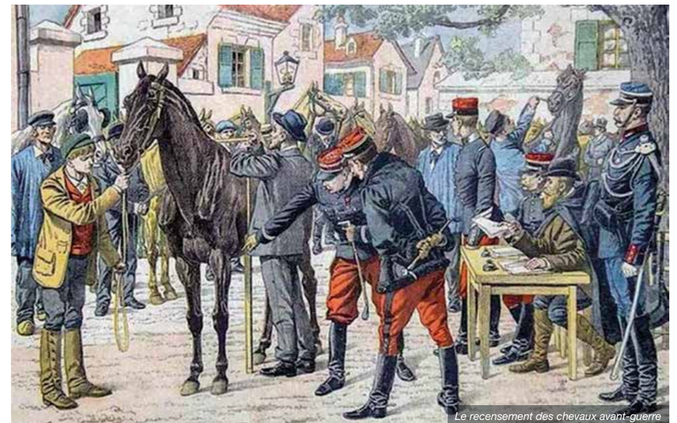
Le recensement des chevaux avant-guerre

La célébration du centenaire de la première guerre mondiale arrivant à son terme, cet article est l'occasion d'évoquer la participation des vétérinaires à la Grande guerre et la mémoire des vétérinaires morts pour la France.