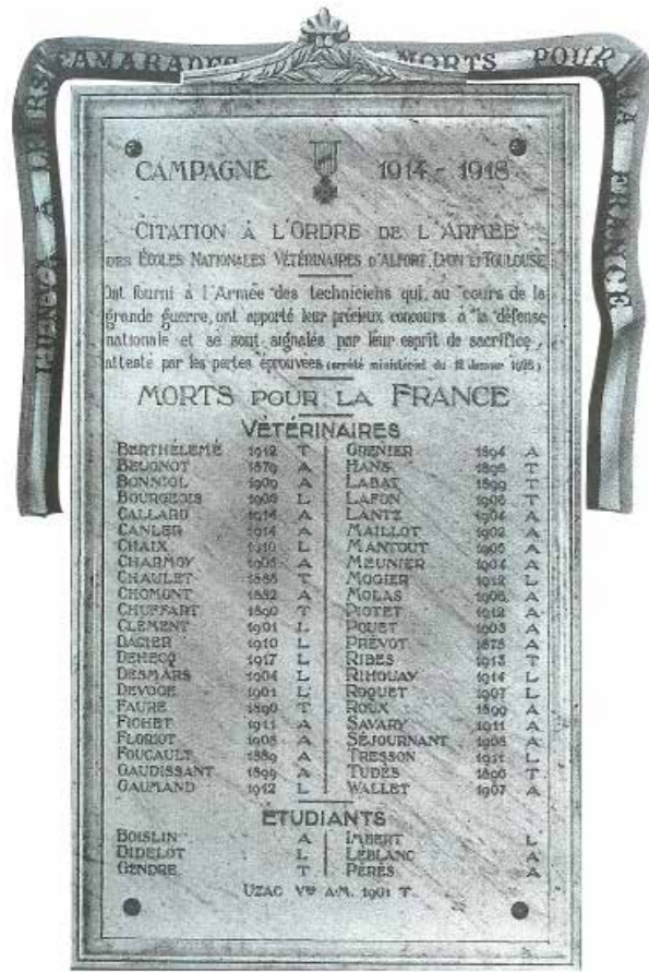
Fac-simile de la plaque commémorative de l'école de cavalerie de Saumur

La guerre de 1914-18 est également le premier conflit où les chiens sont significativement utilisés avec l'emploi d'environ 15 000 animaux : chiens sanitaires pour la localisation des blessés, chiens porteurs, estafettes ou sentinelles. Les vétérinaires seront employés aux soins de ces animaux ainsi qu'à l'inspection vétérinaire des viandes des animaux abattus par ou pour l'armée et à la surveillance des fabrications de conserves.