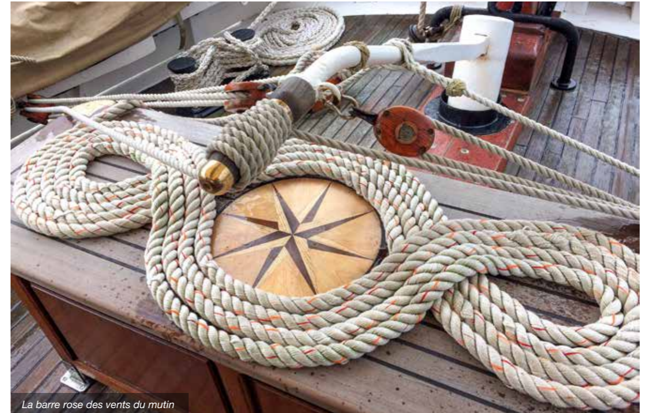
La barre des vents du mutin