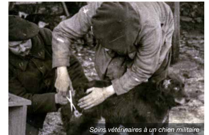
Soins vétérinaires à un chien militaire

Le conflit favorisera certains progrès techniques comme le dépistage des chevaux morveux par la malléation intradermo-palpébrale qui permettra de juguler la propagation de cette maladie contagieuse qui était à craindre avec le rassemblement d'un grand nombre de chevaux à la mobilisation. Faute de moyens de traitement adaptés aux grands effectifs, le service vétérinaire de l'armée aura de grandes difficultés à maîtriser la gale des équidés (460 000 cas recensés, 19% des effectifs touchés en 1918) jusqu'à la mise au point d'un traitement par sulfuration gazeuse qui ne sera généralisé que fin 1918.