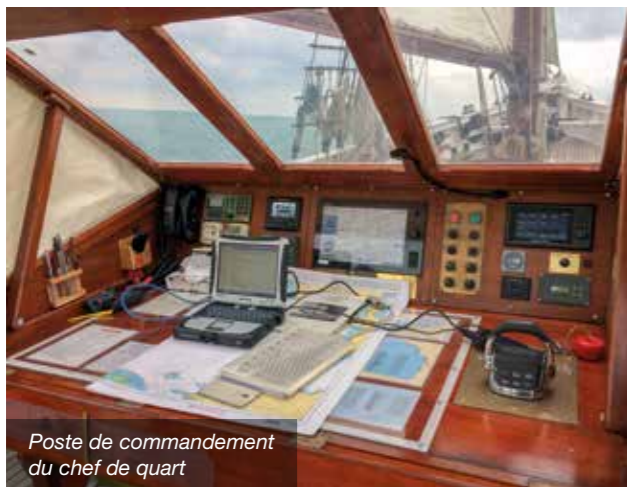
Poste de commandement du chef de quart