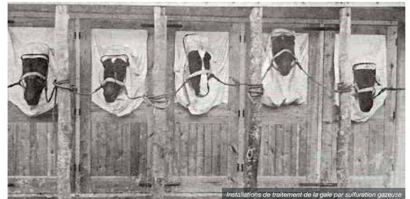
Installations de traitement de la gale par sulfuration gazeuse