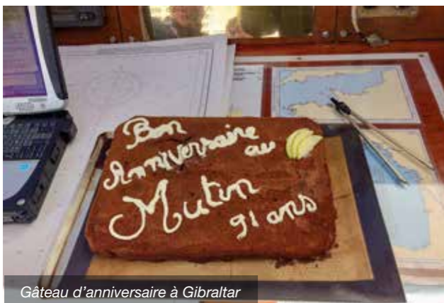
Gâteau d'anniversaire à Gibraltar

Outre son rôle de représentation de la Marine Nationale dans les zones maritimes, le dundee Mutin participe à la formation et au renforcement des valeurs maritimes de jeunes marins mis en subsistance à bord. Composé d'un équipage de 10 permanents, l'unité peut doubler son effectif pour des missions ponctuelles et cela a été le cas. C'est l'éloignement du bâtiment de la côte qui a justifié la présence à bord d'un soignant. Participant à la vie du bord y compris le quart à la mer, il est le lien entre la victime éventuelle et les secours à terre.