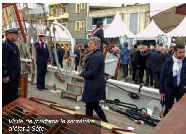
Visite de madame le secrétaire d'état à Sète