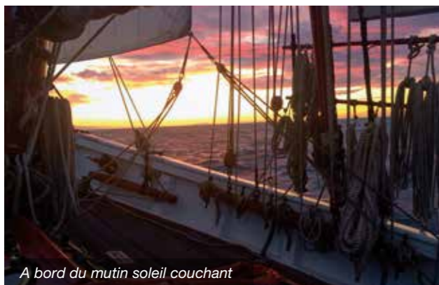
A bord du mutin soleil couchant