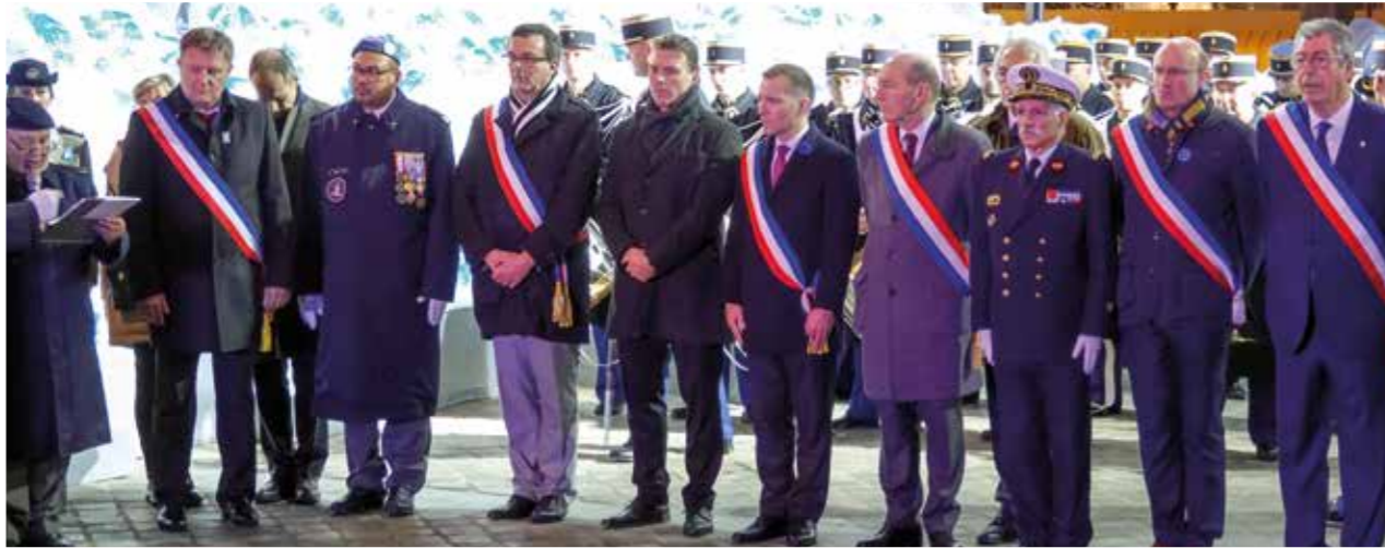
Samedi 10 novembre 2018