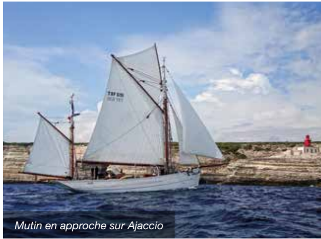
Mutin en approche sur Ajaccio