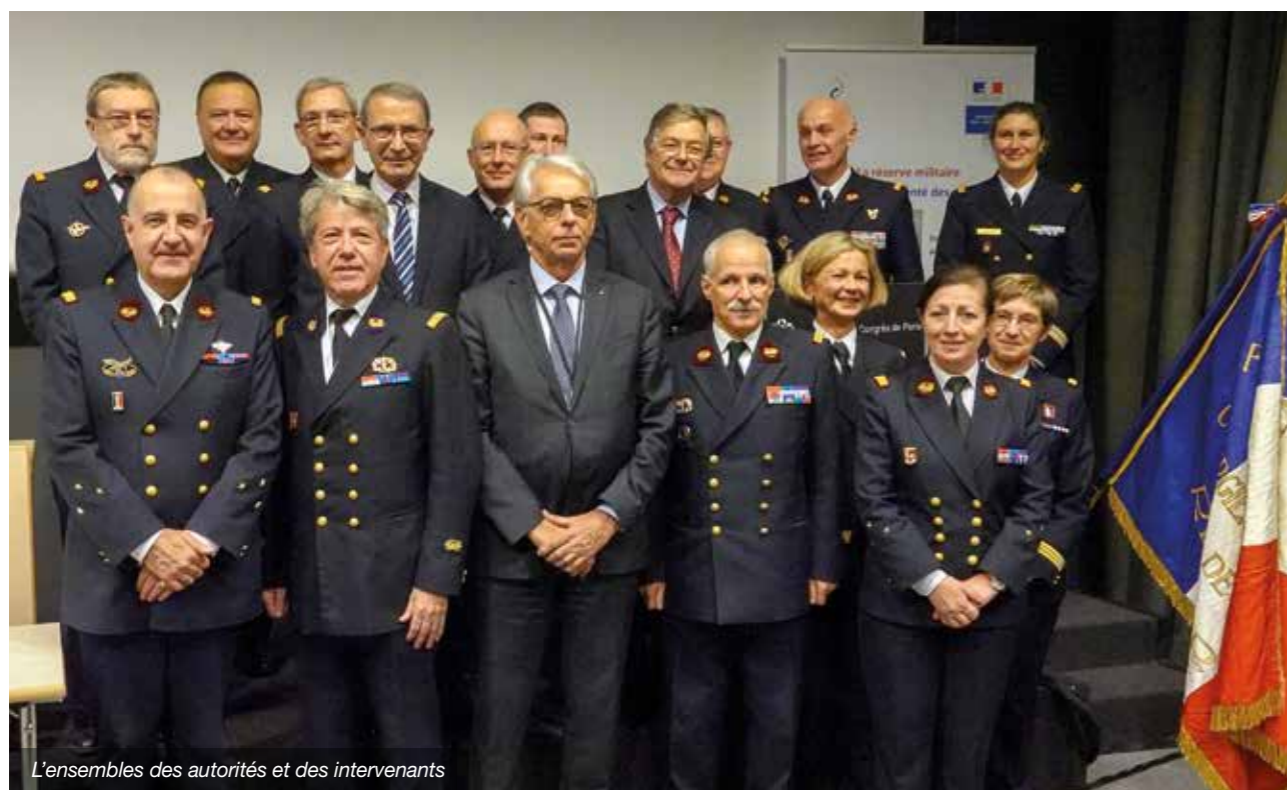
L'ensemble des autorités et des intervenants