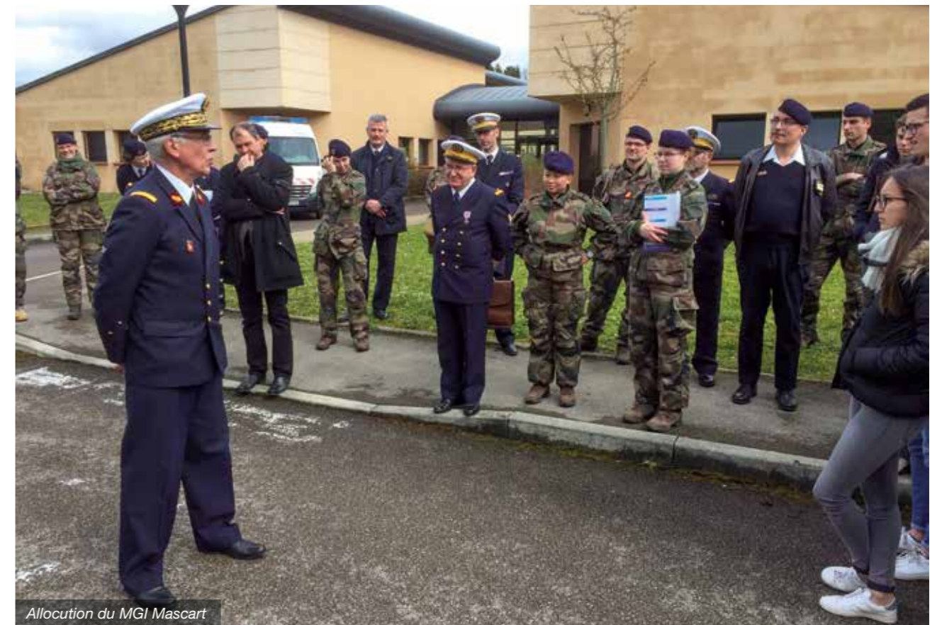
Allocution du MGI Mascart

Le 6 e CMA de Besançon a accueilli dans la 62 e antenne (Besançon-Joffre), à l'initiative du GORSSA, la journée régionale d'instruction des réserves du SSA, placée sous la haute autorité du Directeur Régional du service de santé des armées de Metz.