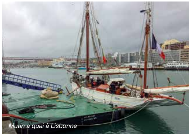
Mutin a quai à Lisbonne