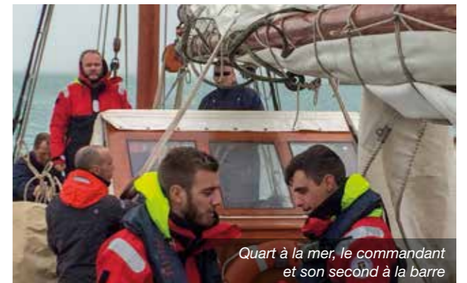
Quart à la mer, le commandant et son second à la barre