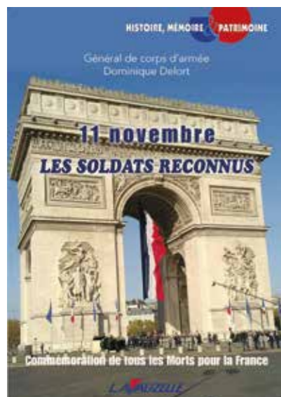
11 NOVEMBRE, LES SOLDATS RECONNUS, par le Général de Corps d'Armée Dominique DELORT, Éditions Lavauzelle

14 Boulevard des Pyrénées - 64000 PAU michel.croizet@free.fr