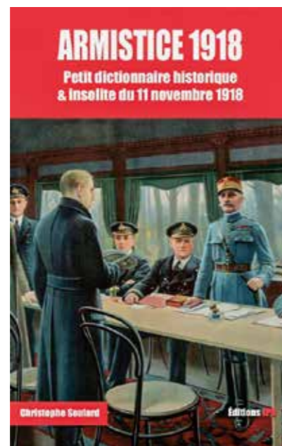
ARMISTICE 1918 . PETIT DICTIONNAIRE HISTORIQUE ET INSOLITE DU 11 NOVEMBRE 1918, par Christophe SOULARD, Éditions JPO

Numéro spécial « Le soutien médical en opérations : les enjeux du transport »