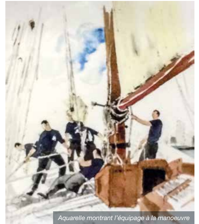
Aquarelle montrant l'équipage à la manoeuvre