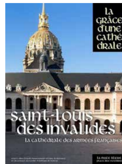
SAINT-LOUIS DES INVALIDES, LA CATHÉDRALE DES ARMÉES FRANÇAISES, dans la série « La grâce d'une cathédrale », Éditions La Nuée Bleue