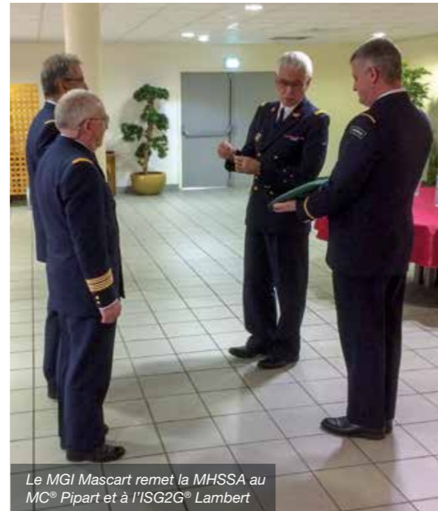
Le MGI Mascart remet la MHSSA au MC ® Pipart et à l'ISG2G ® Lambert

La journée s'achève à 17 h, avec un impact absolument positif pour les étudiants, et une remise à niveau certaine des réservistes, qui sont reconnaissant à toute l'équipe médicale du 6 ° CMA pour le temps et les efforts qu'elle leur a consacrés.