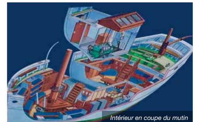
Intérieur en coupe du mutin

Ce printemps, le Mutin a fêté ses 91 ans, un anniversaire qu'il n'a pas célébré en Penfeld mais en