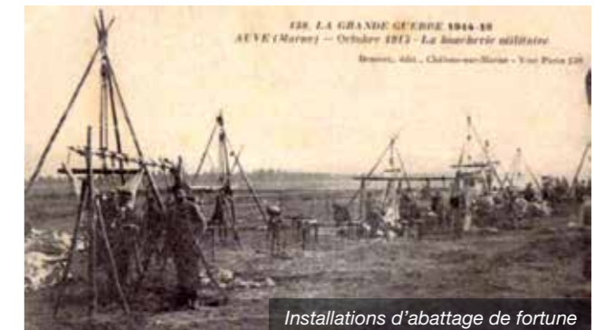
Installations d'abattage de fortune