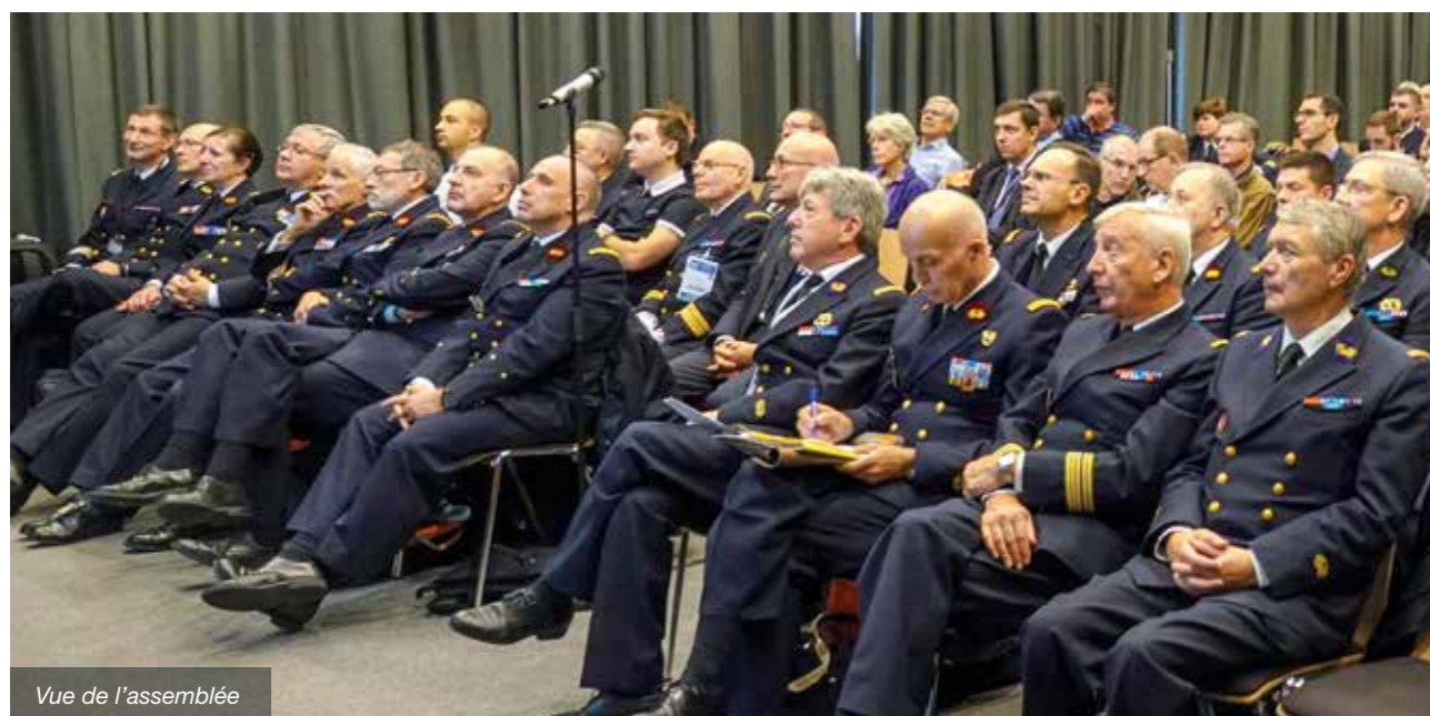
Vue de l'assemblée