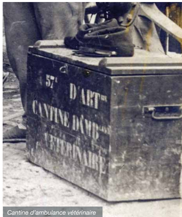
Cantine d'ambulance vétérinaire

Ces pertes sont coûteuses et considérables pour le cheptel équin national qui comptait environ 3 200 000 animaux avant-guerre. Elles ne peuvent être complètement compensées par les importations des Amériques rendues difficiles du fait de la guerre sous-marine. Face à cette hécatombe, le service vétérinaire va être progressivement réorganisé avec la mise en place de structures de soins plus conséquentes permettant de mieux remettre en condition les chevaux malades ou blessés.