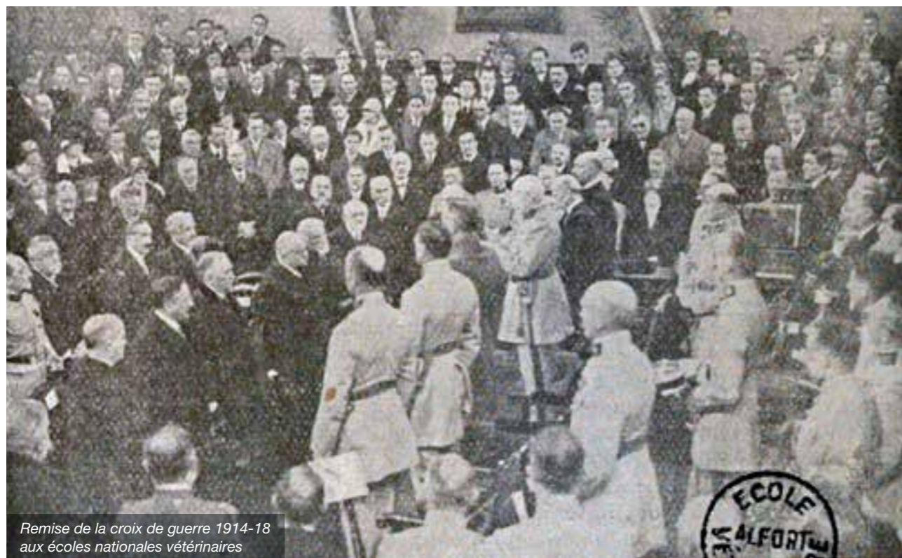
Remise de la croix de guerre 1914-18 aux écoles nationales vétérinaires

Les vétérinaires morts pour la France au cours de la guerre de 1914-1918