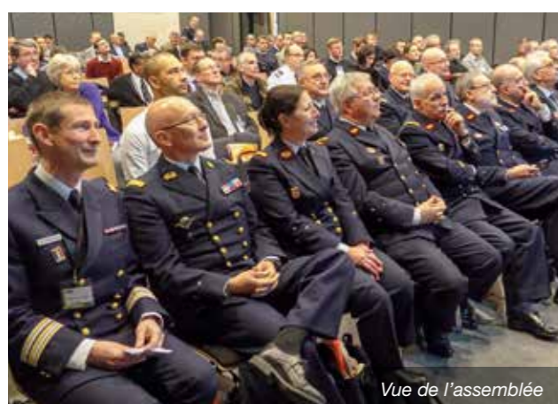
Vue de l'assemblée