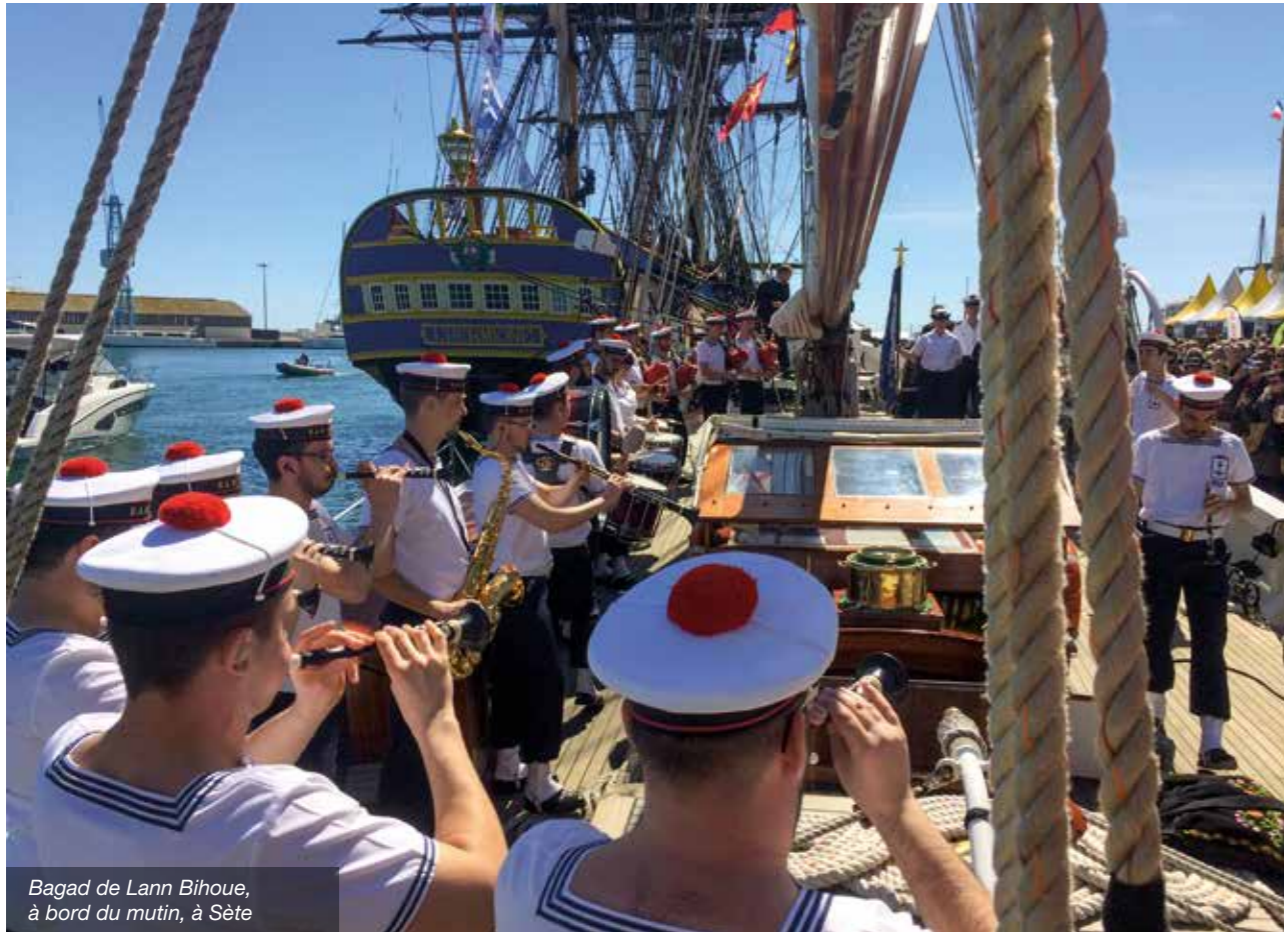
Bagad de Lann Bihoue, à bord du mutin, à Sète