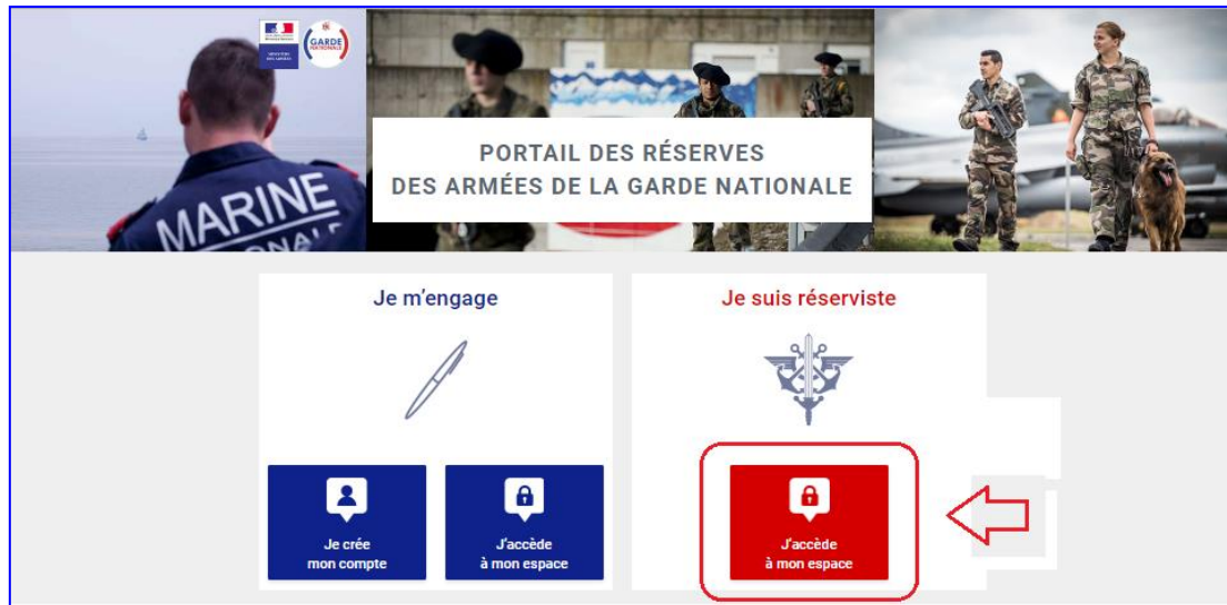
Figure 1 : Page d'accueil du Portail des réserves des armées de la garde nationale

1. Pour accéder au site www.etrereserviste.fr cliquez sur le pavé « J'accède à mon espace » :