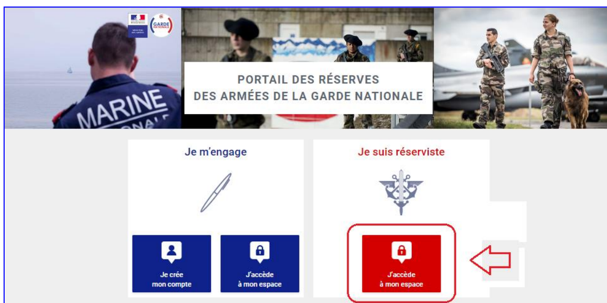
Figure 8 : Accéder à l'espace personnel du réserviste

7. A chaque nouvelle connexion, vous devez saisir votre identifiant et votre mot de passe modifié à partir de l'adresse www.etrereserviste.fr en cliquant sur le pavé « J'accède à mon espace » :