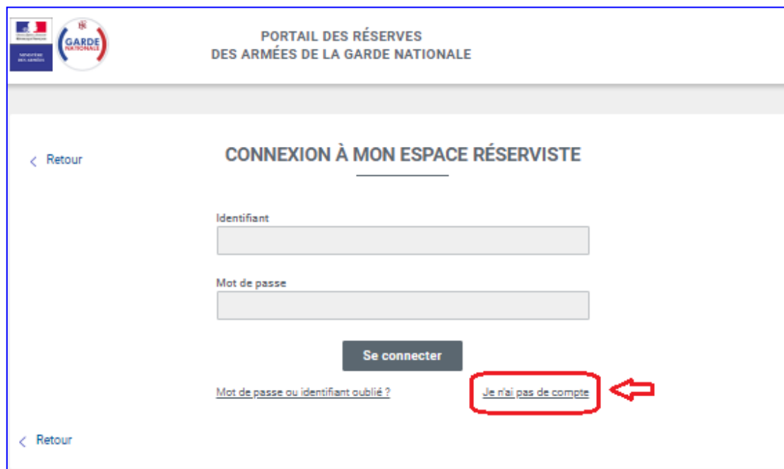
Figure 2 : Accéder à l'espace réserviste et créer un compte

2. Cliquez sur « Je n'ai pas de compte » :